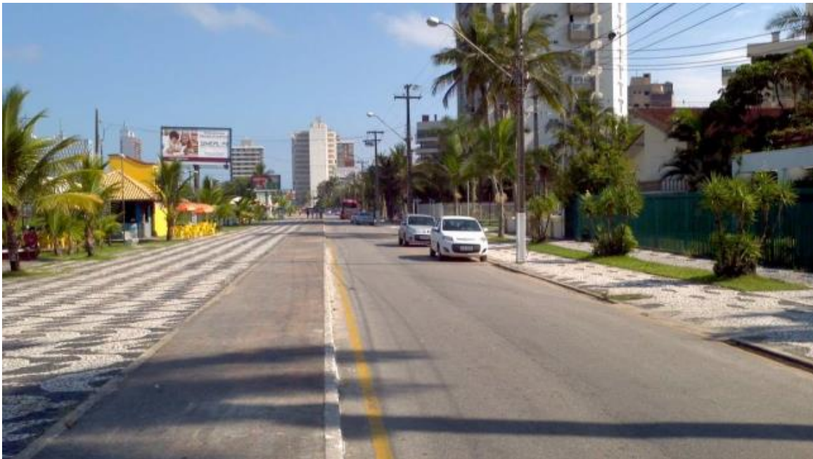
Trecho 1 B – Av. Atlântica – Capa Asfáltica CBUQ

O trecho denominado Trecho 1B é o segmento da Av. Atlântica entre o Canal da Av. Paraná até o Pico de Matinhos. A extensão aproximada é de 1600 m. de pavimentação asfáltica. Estima-se que 10% dessa área necessita de consertos localizados e em seguida será executado o recapeamento de todo o trecho.