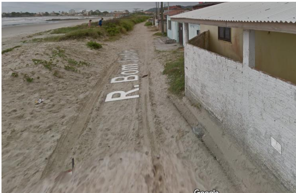
Extensão da Av. Beira Mar – Pavimentação nova após criar plataforma

O trecho caracterizado como trecho 2D também se refere a um projeto novo e se estende a Av. Beira Mar em mais 700m rumo ao centro de Matinhos.