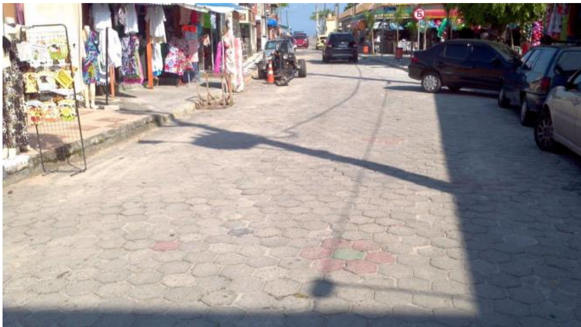
Trecho 2A– Rua das Sereias – Elementos de concreto pré-moldado sextavado

O trecho 2B, com extensão aproximada de 328m compõe o bolsão de acesso e saída do Mercado do Peixe. Seu revestimento atual é em elementos pré-moldados de concreto sextavado que se encontram com superfícies irregulares em alguns pontos, evidenciando falta de capacidade de suporte das camadas inferiores. Cerca de 20% dessa área carece remoção dos elementos e substituição da base e sub-base. Posteriormente a indicação é recapeamento com CBUQ Faixa C DER/PR com 5 cm de espessura em toda a área.