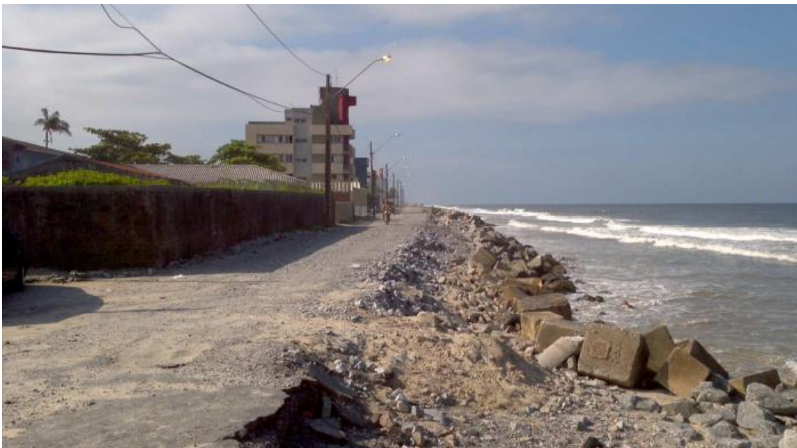
Trecho 3 – Avenida Beira Mar – trecho erodido pela ação marinha. Necessita recompor a plataforma e pavimentação

A partir da Rua Tamboara até o final do trecho a ser revitalizado o asfalto permaneceu hígido, não apresentando deformidades notórias das camadas inferiores, no qual revitalizá-lo com uma delgada camada de microrrevestimento asfáltico com emulsão polimerizada deixará seu aspecto com condições homogêneas aos demais trechos do projeto urbanístico global. A extensão aproximada é de 2245m.