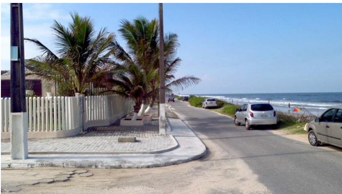
Trecho 3 – Av. Beira Mar – Pavimentação não apresenta problemas estruturais

A partir da Rua Tamboara até o final do trecho a ser revitalizado o asfalto permaneceu hígido, não apresentando deformidades notórias das camadas inferiores, no qual revitalizá-lo com uma delgada camada de microrrevestimento asfáltico com emulsão polimerizada deixará seu aspecto com condições homogêneas aos demais trechos do projeto urbanístico global. A extensão aproximada é de 2245m.