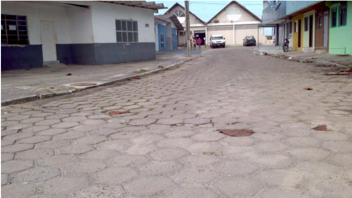
Trecho 2B – Bolsão de Acesso ao Mercado do Peixe - Elementos de concreto pré-moldado sextavado

O trecho 2C trata do novo projeto destinado ao espaço para acesso e estacionamento de ônibus de turismo. Sua extensão é de aproximadamente 582m.