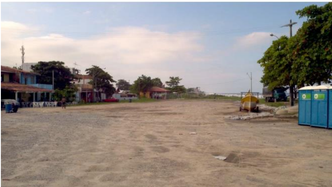
Trecho 2C – Estacionamento de Ônibus de Turismo – Terreno natural e Pavimentação nova

O trecho 2C trata do novo projeto destinado ao espaço para acesso e estacionamento de ônibus de turismo. Sua extensão é de aproximadamente 582m.