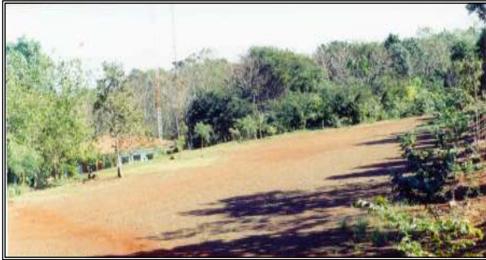
Foto VI.03 - Vista do Estacionamento do Parque