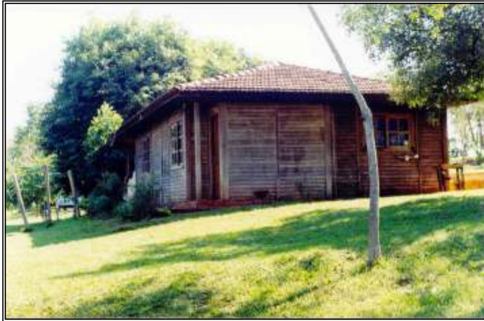
Foto VI.05 - Vista da Casa de Guarda-Parque Existente no Parque