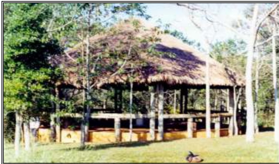
Foto VI.06 - Vista da Choupana Existente no Parque