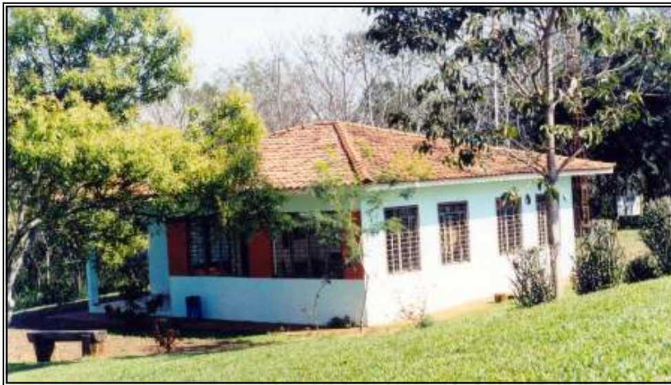
Foto VI.04 - Centro de Visitantes do Parque