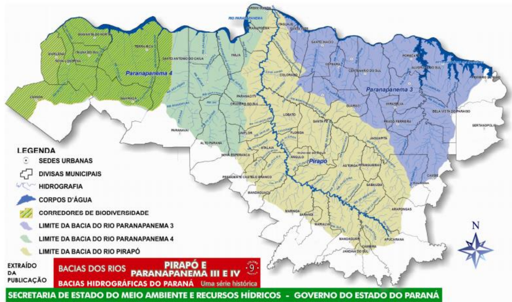
Figura 1: Mapa de abrangência do CBH Piraponema.

Ainda, a UGRHI do rio Pirapó, Paranapanema 3 e 4 drena a vertente esquerda do rio Paranapanema, integrando parte de sua Bacia (Figura 2). Por isso, o CBH Piraponema, em conjunto com outros dois CBHs paranaenses e três CBHs paulistas, constituem o Comitê Interestadual da Bacia Hidrográfica do Rio Paranapanema.