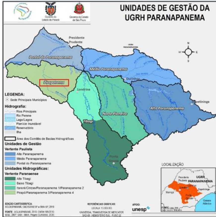
Figura 2: Unidades de gestão UGRH Paranapanema.

Segundo dados do Censo Demográfico de 2010 do IBGE, a população que ocupa a área de abrangência do CBH Pirapó é de aproximadamente 830 mil habitantes. Os municípios que estão inseridos total ou parcialmente na área do Comitê somam 56, sendo eles: Alto Paraná, Alvorada do Sul, Ângulo, Apucarana, Arapongas, Astorga, Atalaia, Bela Vista do Paraíso, Cafeara, Cambé, Cambira, Centenário do Sul, Colorado, Cruzeiro do Sul, Diamante do Norte, Florestópolis, Flórida, Guairaçá, Guaraci, Iguaraçu, Inajá, Itaguajé, Itaúna do Sul, Jaguapitã, Jandaia do Sul, Jardim Olinda, Loanda, Lobato, Lupionópolis, Mandaguaçu, Mandaguari, Marialva, Maringá, Miraselva, Munhoz de Mello, Nossa Senhora das