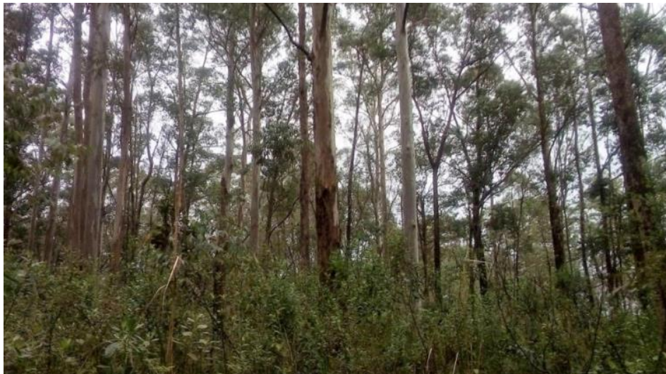
Figura 1: Área de reflorestamento com Eucaliptos