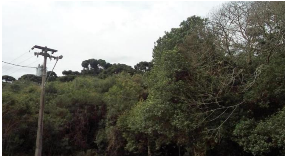
Figura 3: Observa-se ao fundo, área remanescente de Floresta com Araucária