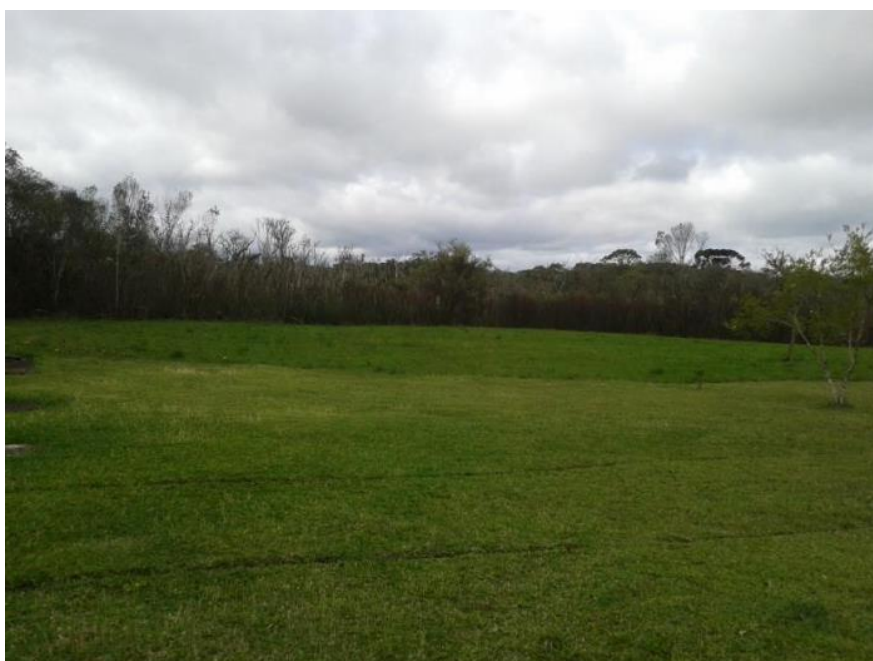
Figura...: Heliponto Base FEM