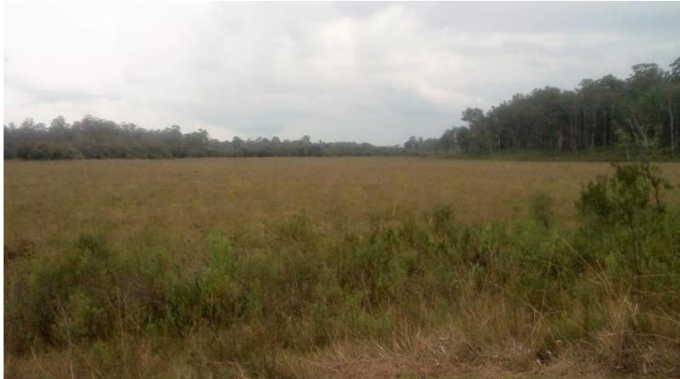
Figura 2: Campo Edáfico