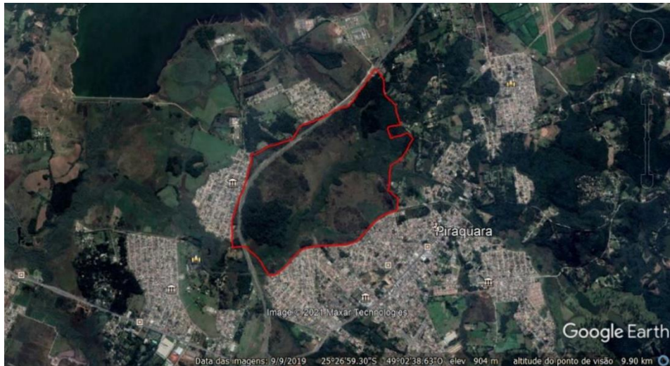
Figura 4: Delimitação da Floresta Estadual Metropolitana