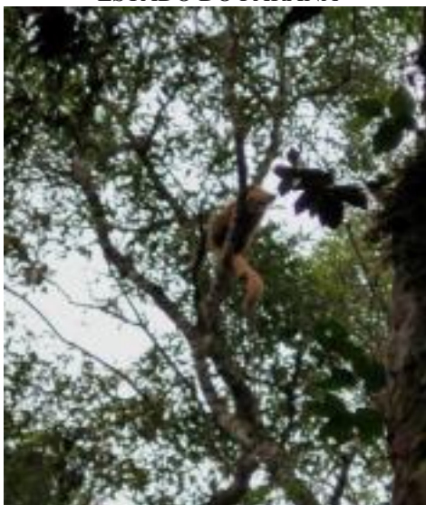
FIGURA 1 – QUATI-DA-CAUDA-ANELADA EMPOLEIRADO NO PARQUE ESTADUAL DO MONGE, ESTADO DO PARANÁ