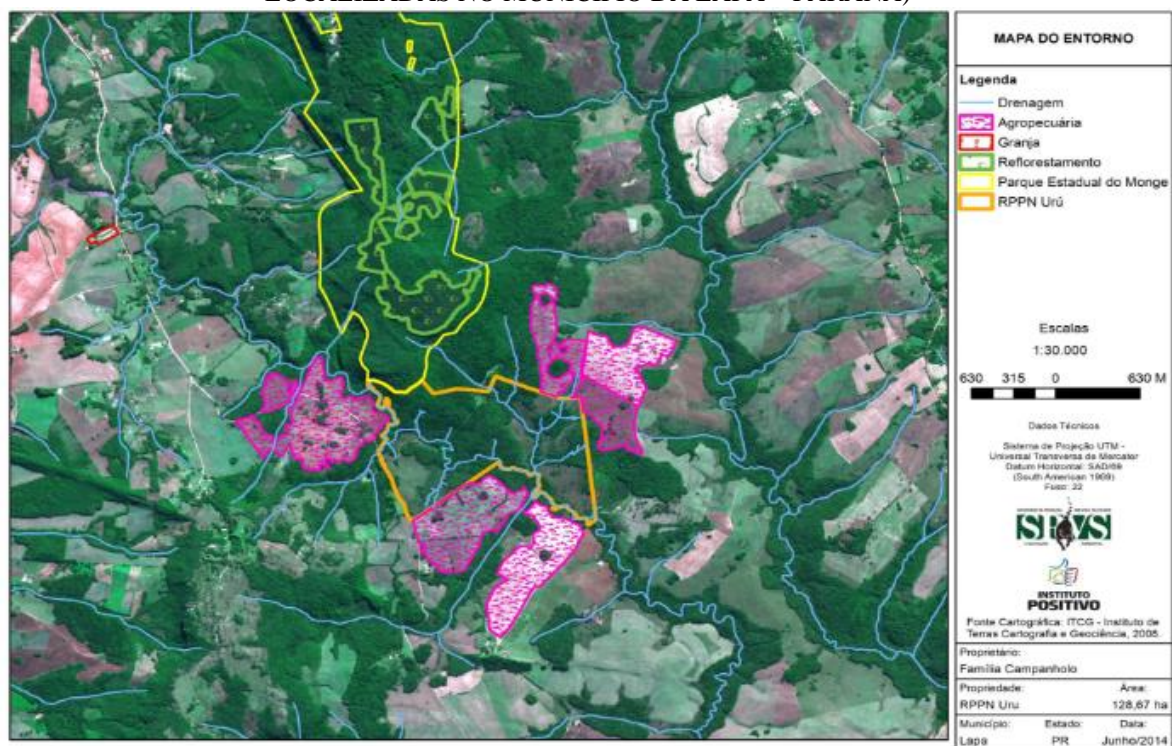
FIGURA 3 – ENTORNO DA RPPN URU E DIVISA COM PARQUE ESTADUAL DO MONGE (AMBAS LOCALIZADAS NO MUNICÍPIO DA LAPA – PARANÁ)