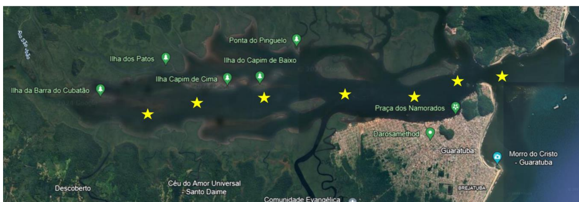
Figura 2. Possíveis pontos que serão amostrados na Baía de Guaratuba estão demarcados com estrela amarela. Serão realizados arrastos para coleta de microplástico desde a desembocadura até a área mais interna da baía.

Os arrastos serão realizados semestralmente em setores a serem definidos da Baía de Guaratuba (Figura 2), desde a cabeceira até a desembocadura da baía, tendo pelo menos três réplicas por área, como sugerido por GESAMP (2019) ao longo de 36 meses restantes do projeto que tem duração total de 48 meses.