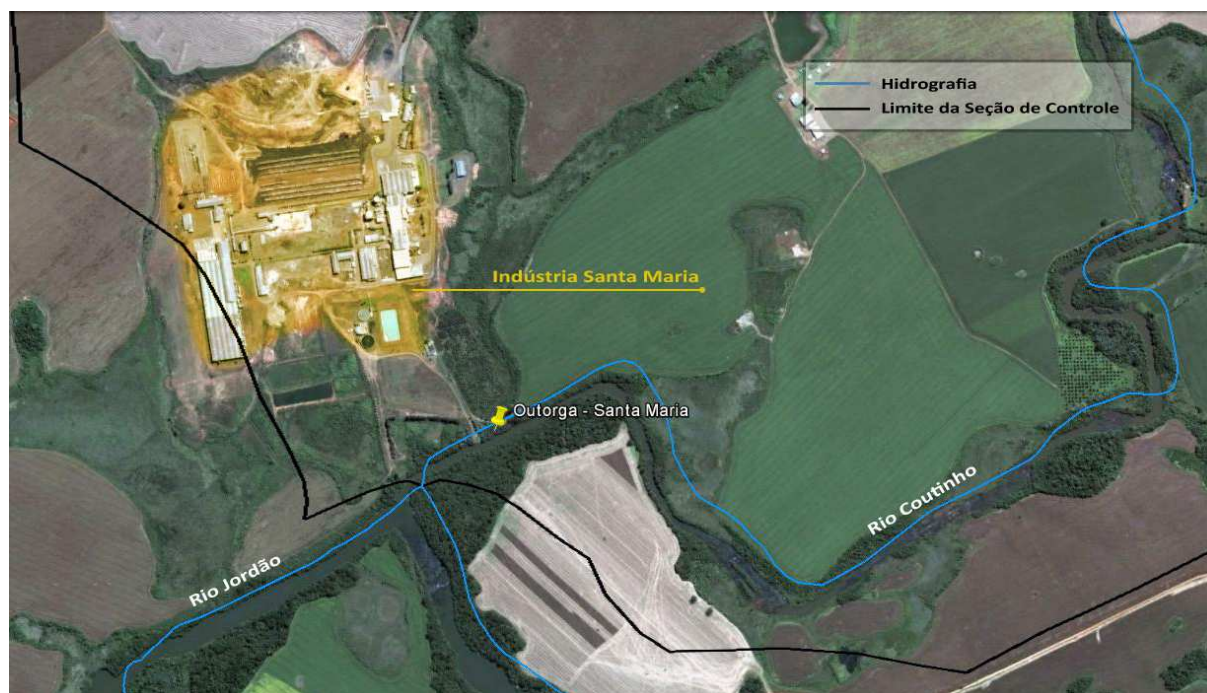
Figura 2.2. Santa Maria Companhia de Papel e Celulose