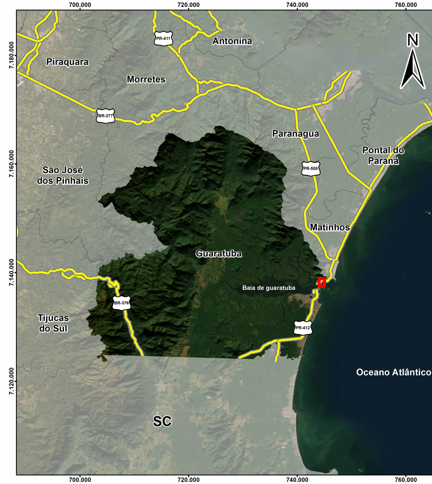
PLANTA DE LOCALIZAÇÃO 1:400.000 IMAGEM DE SATÉLITE 1 cm = 4 km

0 5 10 20 km Sistema de Referência: SIRGAS 2000 Projeção Cartográfica: UTM, Fuso 22S Meridiano Central: 51° W