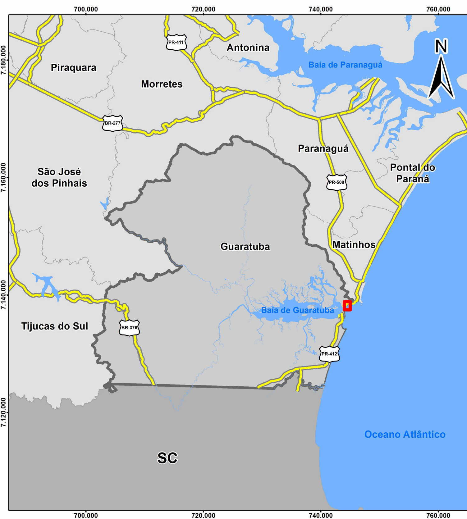
PLANTA DE LOCALIZAÇÃO 1:400.000 1 cm = 4 km

0 5 10 20 km Sistema de Referência: SIRGAS 2000 Projeção Cartográfica: UTM, Fuso 22S Meridiano Central: 51° W